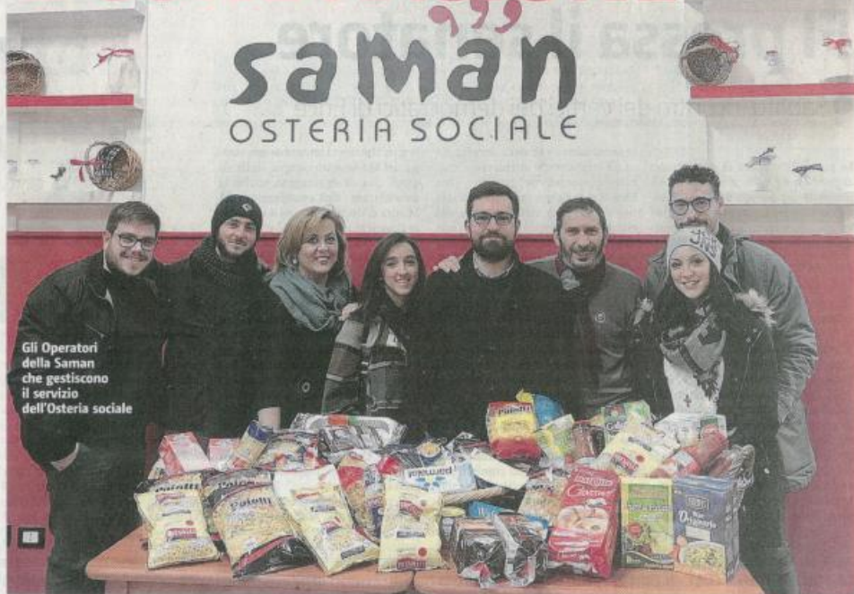
Gli Operatori della Saman che gestiscono il servizio dell'Osteria sociale